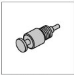
Wikkelenerschep vliegwijs OE (LRT-12-044)